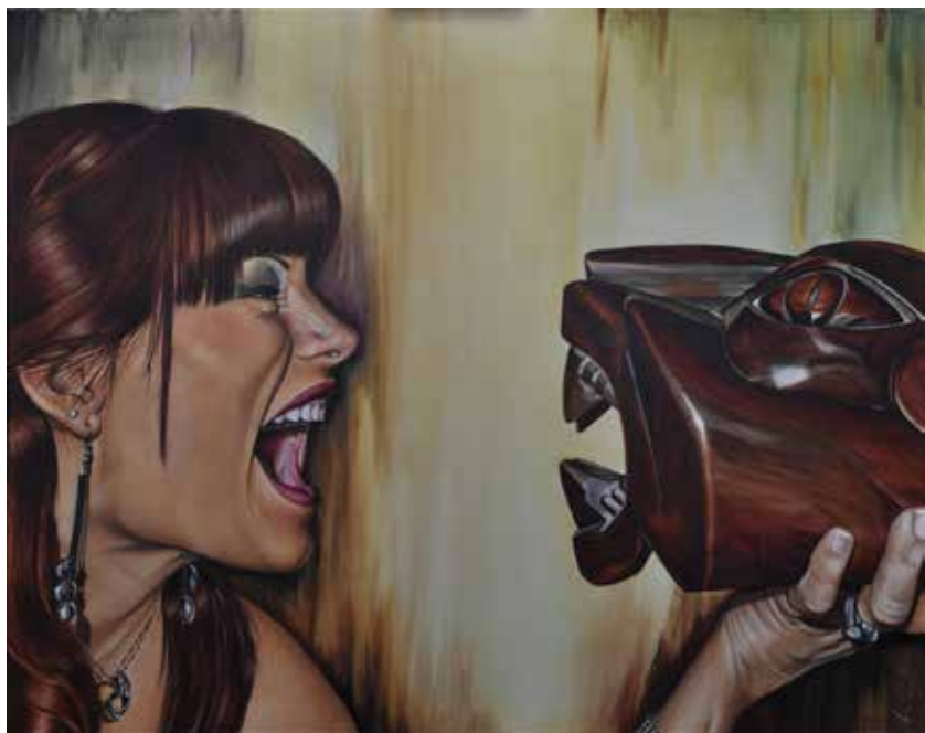
Osadia. Óleo sobre lienzo, 100 x 80 cm