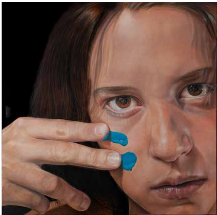
Pax in bello. Óleo sobre lienzo, 100 x 100 cm