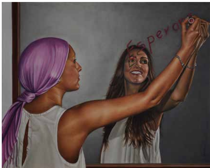
Reflejo de vida. Óleo sobre lienzo, 100 x 80 cm