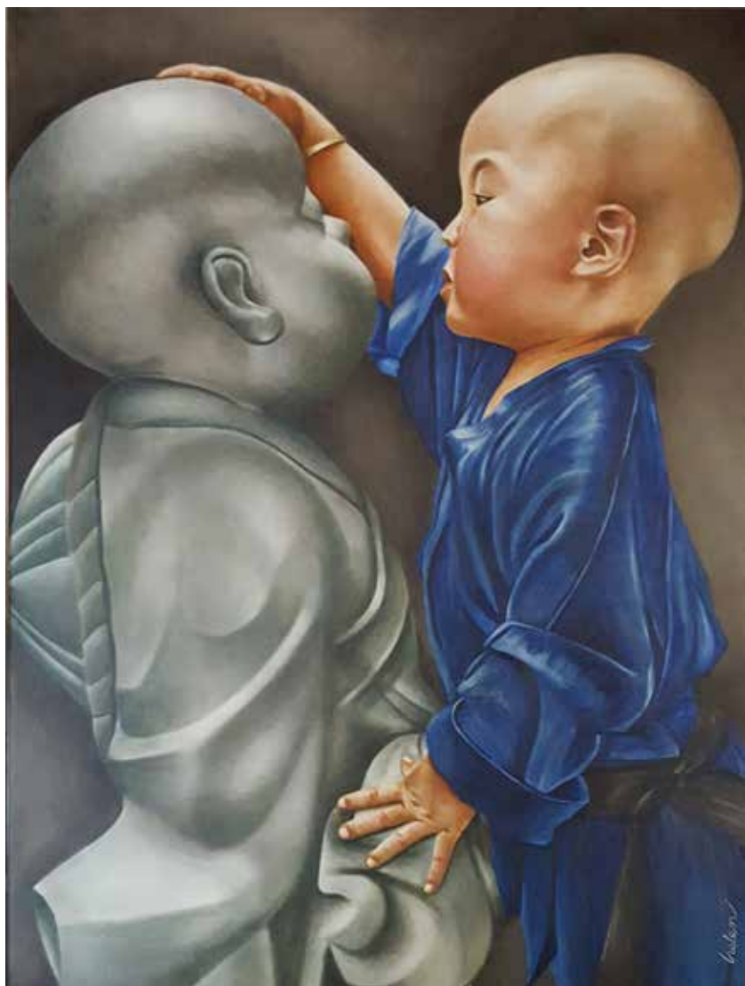
Mi yo. Óleo sobre lienzo, 60 x 80 cm