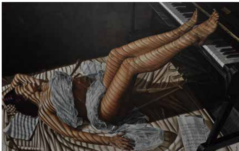
Armonía de luz. Óleo sobre lienzo, 160 x 100 cm