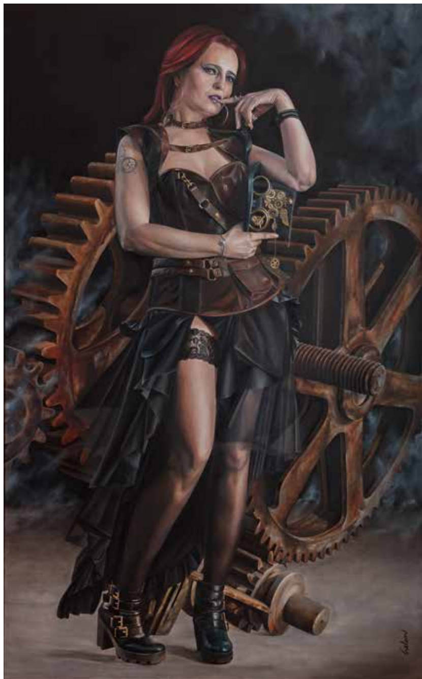
Art revolution. Óleo sobre lienzo, 100 x 160 cm