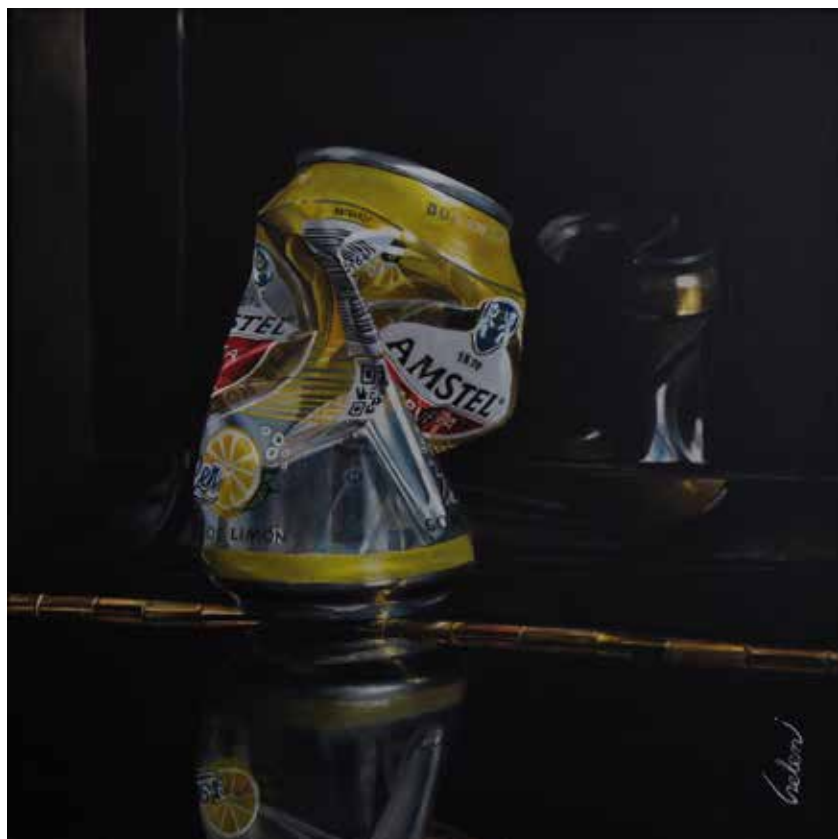
La belleza de lo simple. Óleo sobre lienzo, 40 x 40 cm