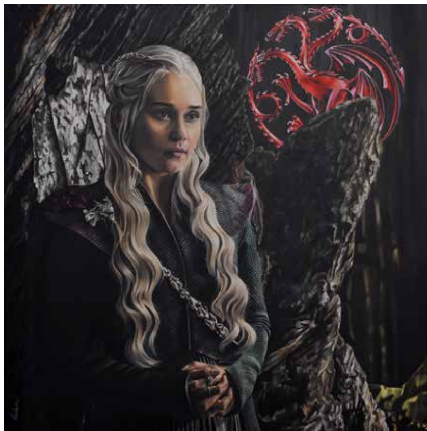
Madre de dragones. Óleo sobre lienzo, 100 x 100 cm