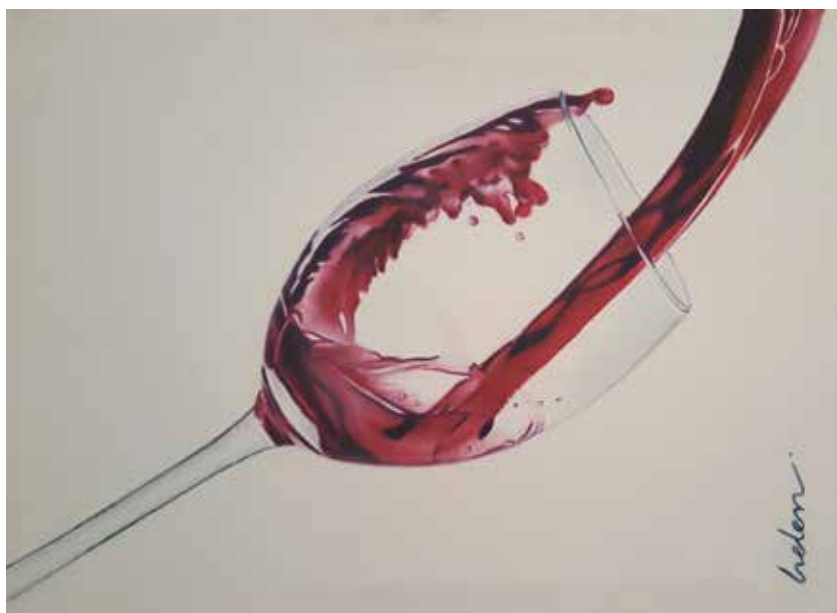
Colección bodega 2. Óleo sobre lienzo, 40 x 30 cm