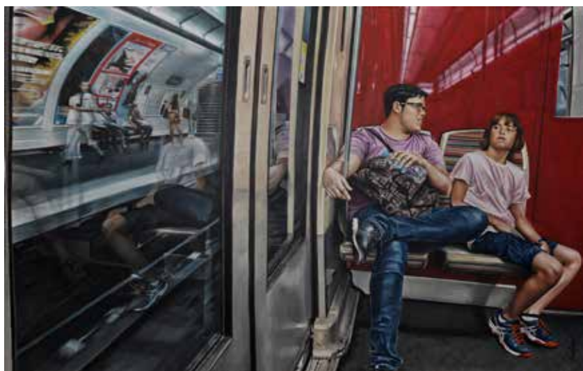
Train de vie. Óleo sobre lienzo, 160 x 100 cm