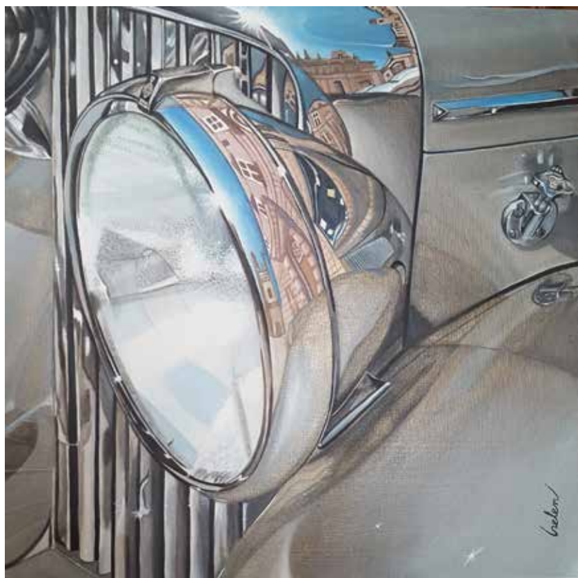
Reflejos del ayer. Acrílico sobre tabla entelada, 40 x 40 cm