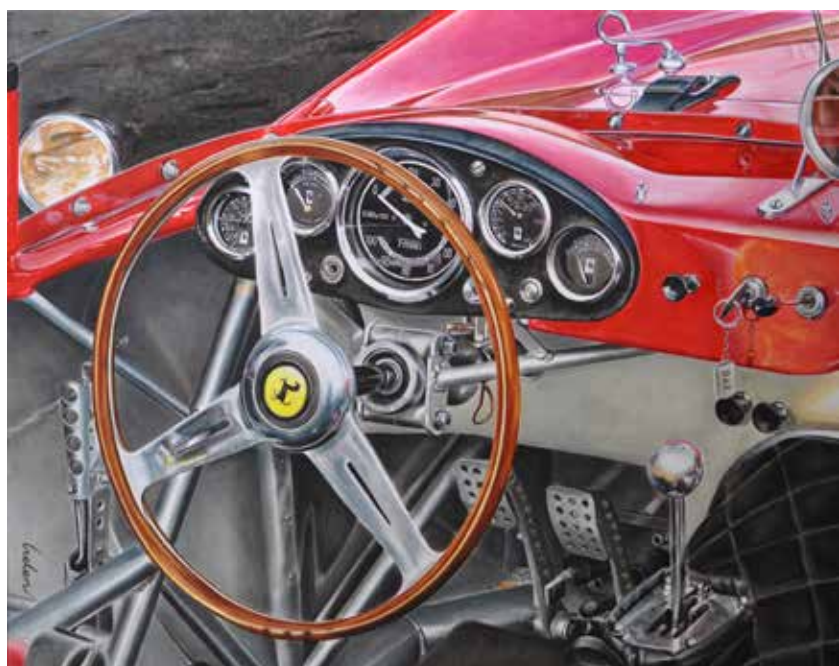
Capricho. Óleo sobre lienzo, 100 x 80 cm