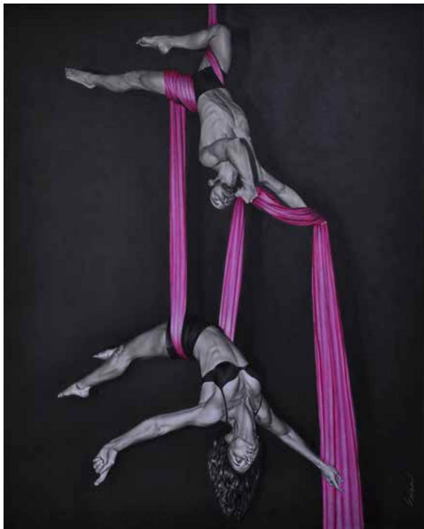
Cuenta conmigo. Oleo sobre lienzo, 100 x 80 cm