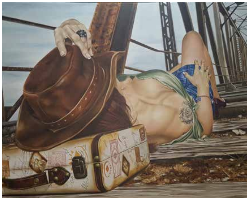
Tu tiempo. Óleo sobre lienzo, 100 x 80 cm