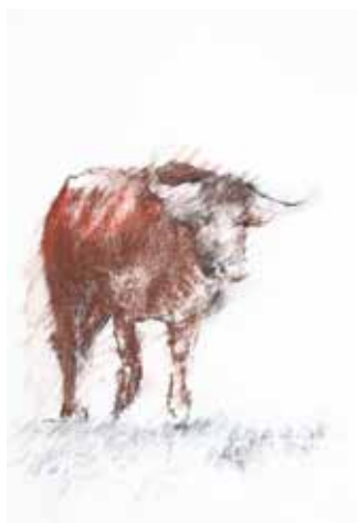
"En la niebla"