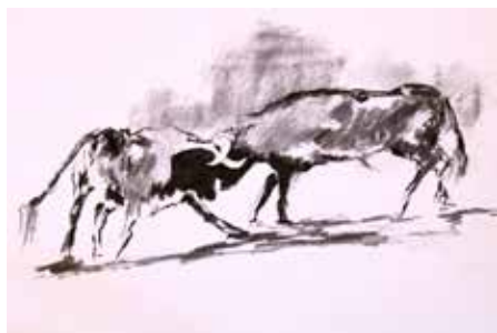
"Pelea de toros bravos"