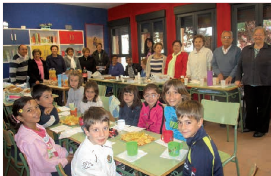
Experiencia intergeneracional en Cogeces de Íscar

En torno a la Constitución y la Identidad Europea, junto a centros de Noruega e Italia, a lo largo de los cursos 1999 al 2001. De allí surgieron algunos de los capítulos más brillantes que hemos escrito-leído juntos a lo largo de estos años y que llevaban por título Fronteras de Sal: El viaje de la Andrómeda. Aquí los granos de arena se nos hicieron bits y las páginas