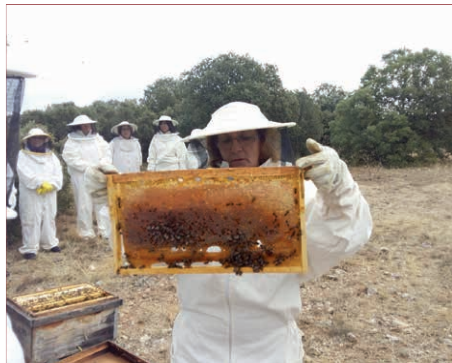
Actividad de apicultura del alumnado de la zona de Medina de Rioseco

Han sido numerosos y muy variados los proyectos educativos en el territorio, otros de manera compartida. Unos durante