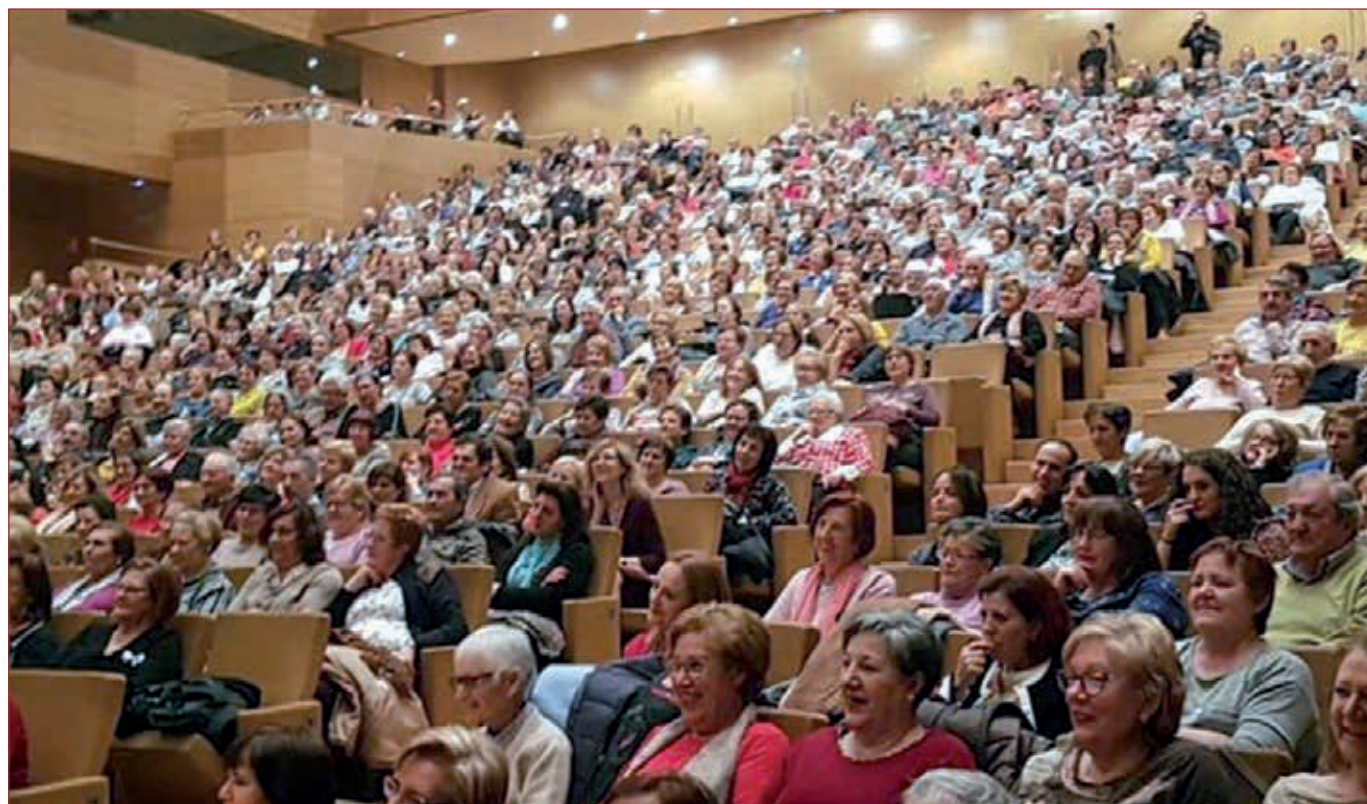
Alumnado en el Auditorio Miguel Delibes con motivo de la celebración de 35 aniversario de las Aulas de Cultura

Durante 15 años convivieron el programa de Aulas de Cultura y el de Educación de Adultos. Este último, al amparo de un convenio entre el Minis-