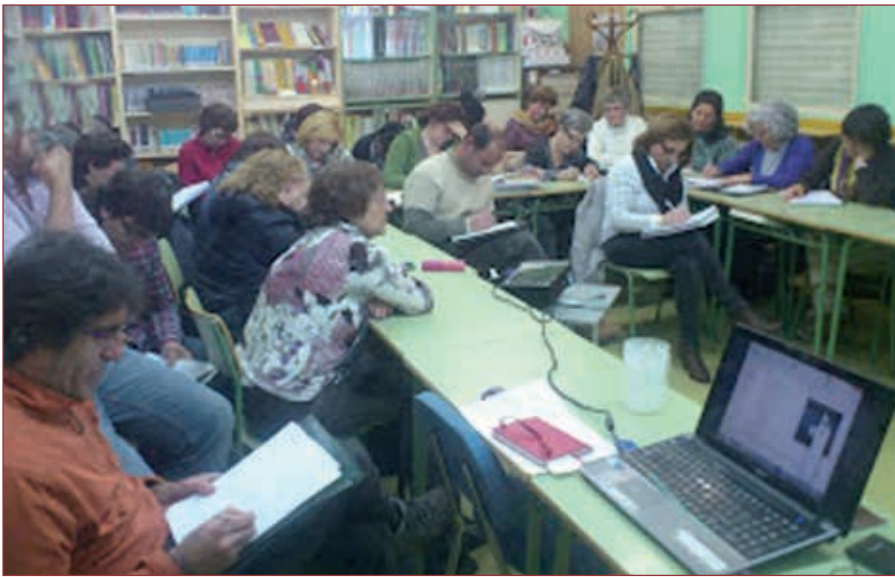
◉ Proyecto Mar de Incertidumbres en Tordesillas

que, juntas unas de otras, crearon una gran obra colectiva.