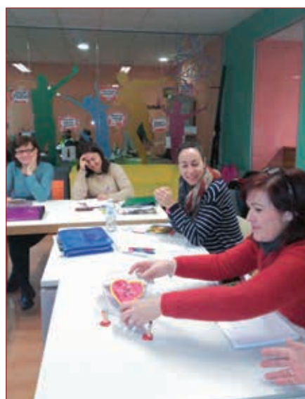
◉ Proyecto de inglés "Hablamos y escuchamos", en la zona de Olmedo

intercambian experiencias, se fomentan relaciones y aumenta la calidad de vida de nuestros pueblos.