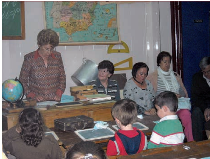
◉ Aula de la Zona de Tudela de Duero