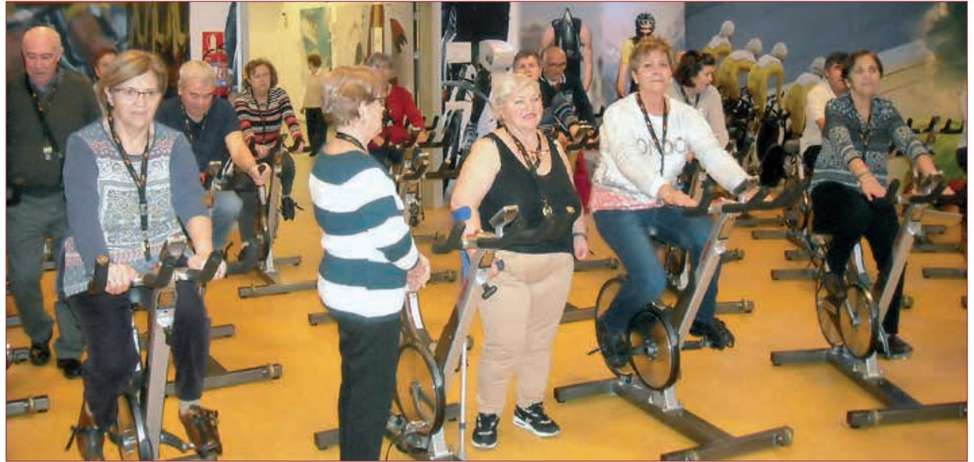
Alumnado de Montemayor de Pililla

Y unanimidad de verbos que han salido al hablar de la finalidad del Aula: “recordar, socializar, convivir, aprender, soltar, desconectar” , para luego pasar a expresiones del tipo “crecimiento personal, pérdida del miedo, quitar prejuicios” .