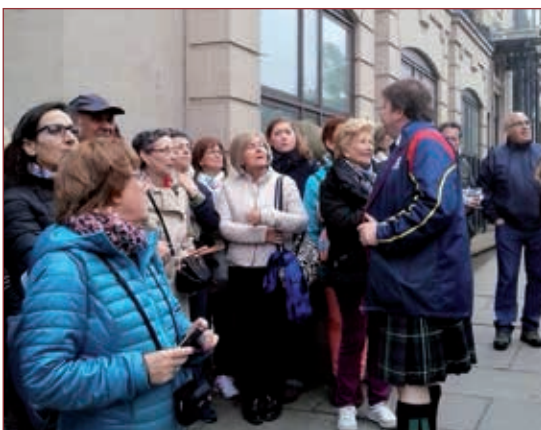
👁 Aula de Ceinos de Campos Encuentro en Matallana en 2016

Encuentro final de curso en Pedrajas de San Esteban