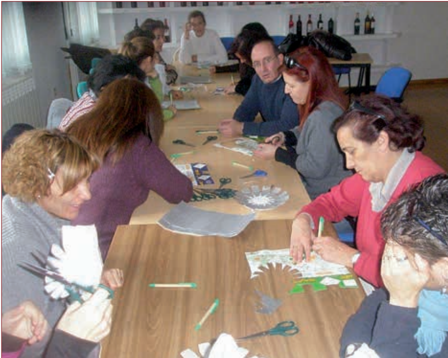
👁 Aula de padres y madres en Mucientes

educativos que se han llevado a cabo, algunos en un curso, otros a lo largo de varios.