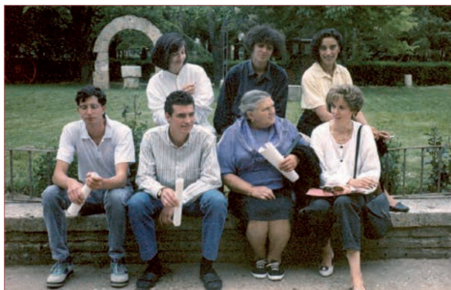
◉ Grupo de Graduado Escolar en Villalán de Campos. Curso 1988-1989

Desde el Ayuntamiento creo que la relación entre municipios es muy enriquecedora para mantener vivo el espíritu de nuestras comarcas. Se