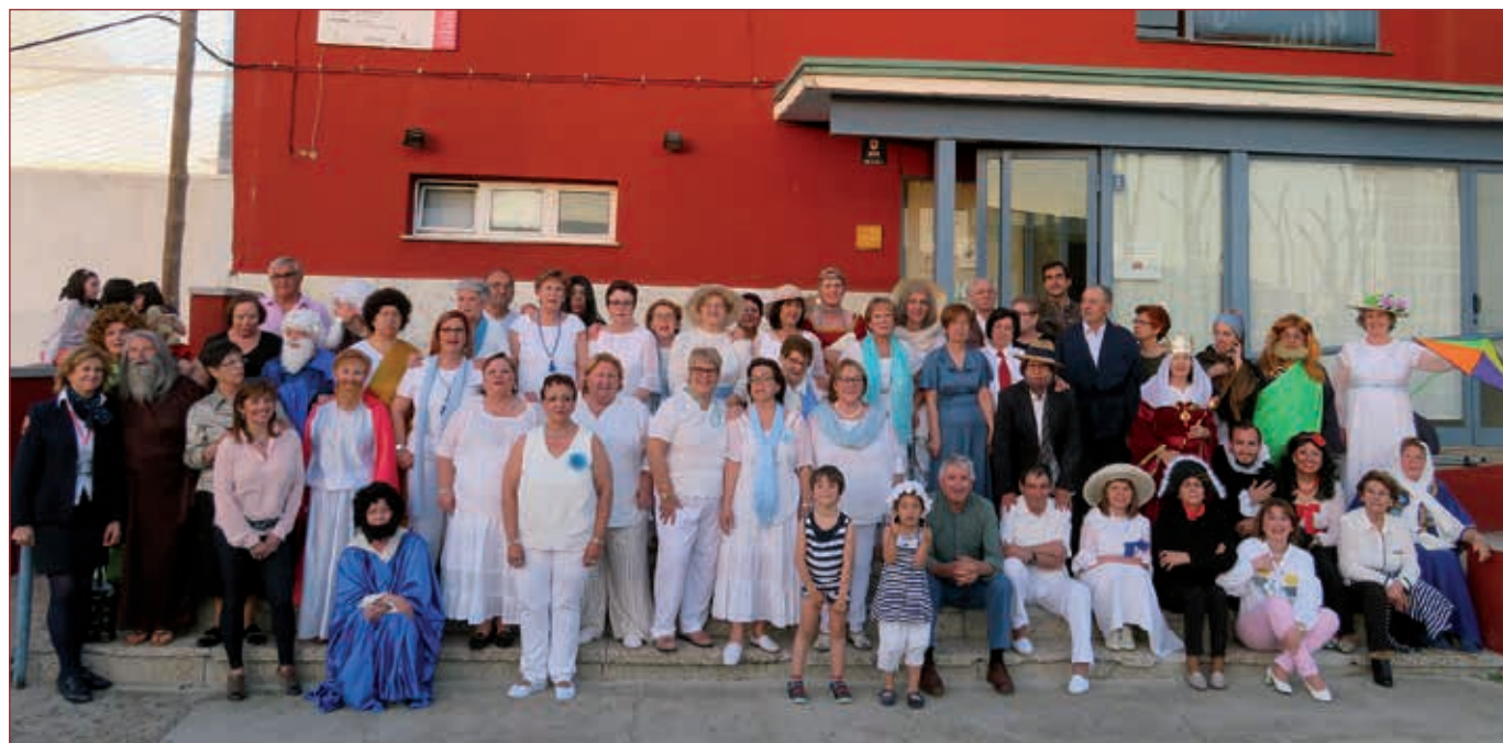
◉ Tudela de Duero

Una participación en la que echamos de menos una mayor presencia de hombres, más del 90% de las alumnas son mujeres. Las mujeres, que his-