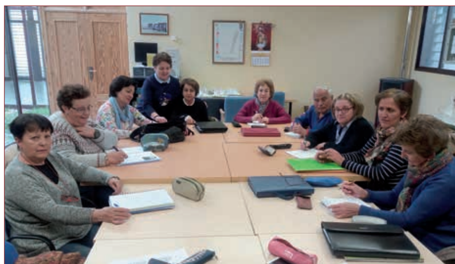
Alumnado en San Pedro de Latarce

Aún conservo la máquina de escribir con la cual preparaba los temarios.