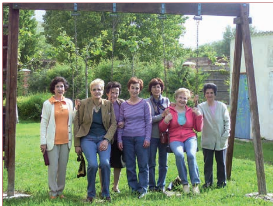
◉ Aula de Encinas de Esgueva y Canillas de Esgueva. Año 2007

Pero lo que tienen claro es que esta incertidumbre no acabará con sus ganas inmensas por seguir partici-